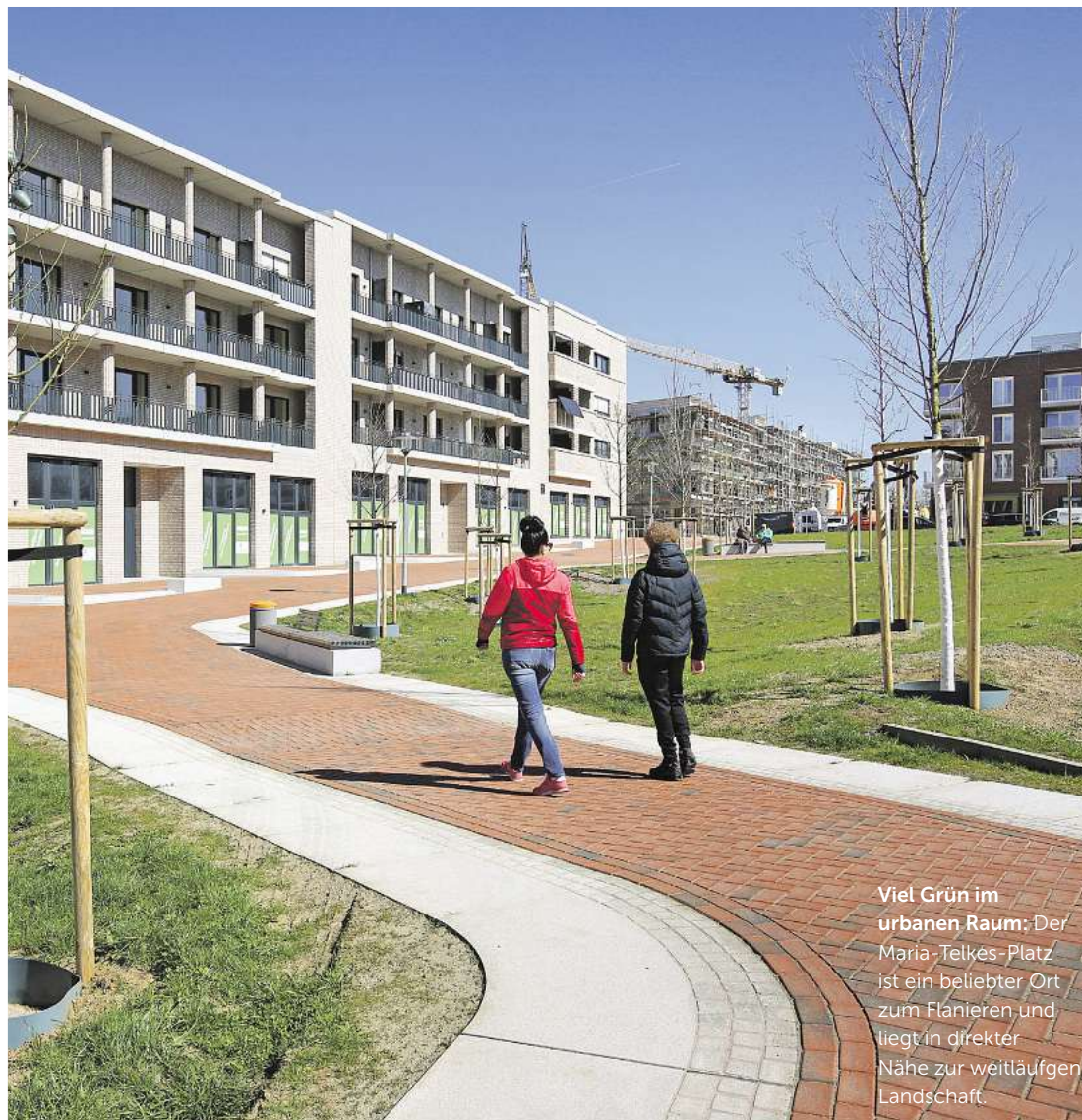
Viel Grün im urbanen Raum; Der Maria-Telkes-Platz ist ein beliebter Ort zum Flanieren und liegt in direkter Nähe zur weitläufigen Landschaft.

tes Baumaterial, die akzentuierte Verwendung von Naturstein, die umlaufenden Einfassungen mit integrierten Sitzgelegenheiten, die Treppen und Podeste zum Ausgleich von Höhenunterschieden sowie die markanten Olivio-Schmuckleuchten haben als wiederkehrende Elemente auf allen Anlagen einen hohen Wiedererkennungswert. So entsteht trotz aller Individualität der einzelnen Plätze eine Platzfamilie, die man direkt mit dem neuen Quartier in Verbindung bringt. Zudem stellen die Plätze die Verbindung zum Stadtteilpark und über diesen hinaus zum Kronsberg her: Landschaft bis direkt vor die Haustür.